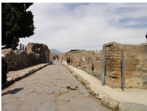
↑古代都市ポンペイの遺跡